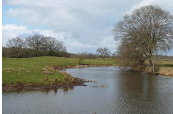
Rust en ...

Rust en drukte zijn uitersten. De uitdaging is kansen te zien waar zij met elkaar verbonden kunnen worden.