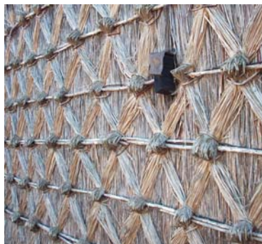
... zien te verbinden