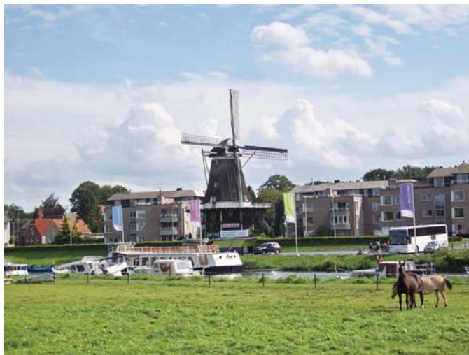
Ommen aan de Vecht

Een dergelijk park kan de centrumfuncties in Ommen versterken, nieuwe bezoekers aanlokken voor de al bestaande campings en bungalowparken, maar voegt zeker iets toe aan het reeds bestaande spectrum. Ommen zou op dat punt het komplan nog eens goed tegen het licht kunnen houden om te bekijken of er niet meer met dit gegeven kan worden gedaan.