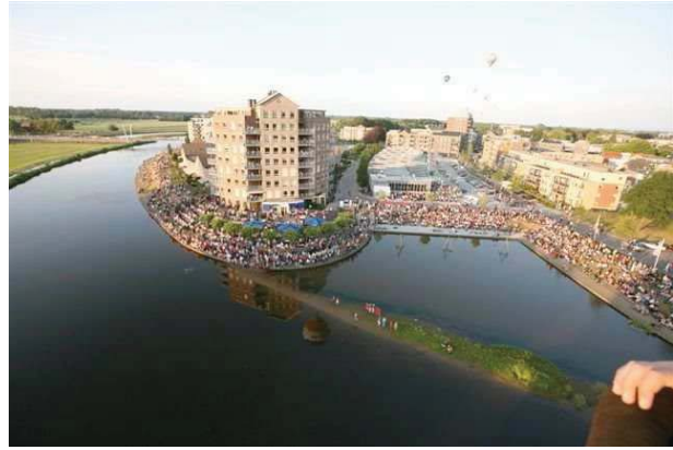
en drukte aan de Vecht bij stad Hardenberg

In Ommen en Dalfsen liggen er direct aan de kernen grenzende delen van het rivierdal die grote mogelijkheden bieden.